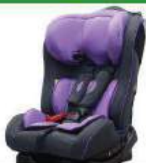
Автокресло группы II для детей массой 13-25 кг